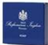
Soap 20 g Parabens Free Dermatologically tested صابون ٢٠ غ