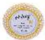
Soap 20g Parabens Free Dermatologically tested صابون ٢٠ غ