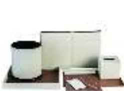
Hotel Leather Set PTZ001 مجموعة جلديات للفنادق