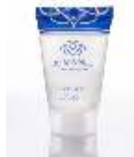
Shower Gel 30 ml Paraben free Dermatologically tested غسول للجسم ٣٠مل