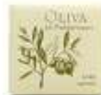
Soap 20 g Parabens free Dermatologically tested صابون ٢٠ غ