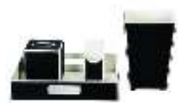
Hotel Leather Set PTZ004 مجموعة جلديات للفنادق