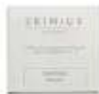
Soap 20 g Paraben free Dermatologically tested صابون ٢٠ غ