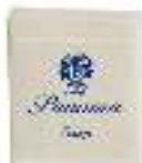
Soap 20g Parabens Free Dermatologically tested صابون ٢٠ غ