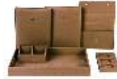
Hotel Leather Set PTZ007 مجموعة جلديات للفنادق