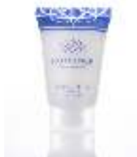
Body Lotion 30 ml Paraben free Dermatologically tested كريم للجسم ٣٠مل