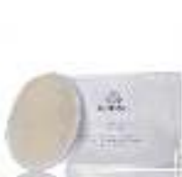
Loofa ليفة استحمام