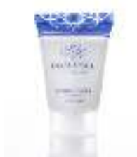
Hair Conditioner 30 ml Paraben free Dermatologically tested ملطف للشعر ٣٠مل