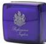
Soap 50 g Parabens Free Dermatologically tested صابون ٥٠ غ