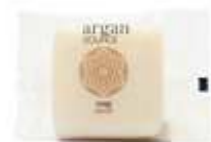
Soap 40 g Parabens free Dermatologically tested صابون ٤٠غ