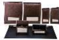
Hotel Leather Set PTZ006 مجموعة جلديات للفنادق