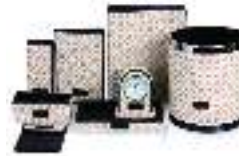
Hotel Leather Set PTZ003 مجموعة جلديات للفنادق