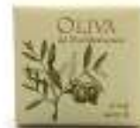
Soap 40 g Parabens free Dermatologically tested صابون ٤٠ غ