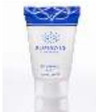
shampoo 30ml Paraben free Dermatologically tested شامبو ٣٠مل