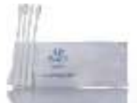
Cotton Buds أعواد قطنية للأذن