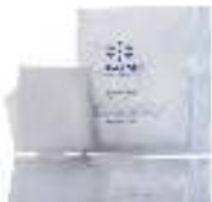
Sanitary bag كيس صحي