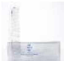
Comb مشط للشعر