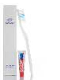
Dental Kit with A.ME paste