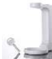
Amenities Wall Bracket علاقة حائط