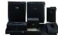
Hotel Leather Set PTZ0011 مجموعة جلديات للفنادق