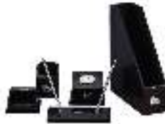
Hotel Leather Set PTZ002 مجموعة جلديات للفنادق