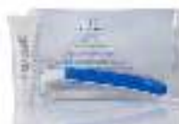
Shaving Kit عدة حلاقة