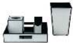
Hotel Leather Set PTZ005 مجموعة جلديات للفنادق