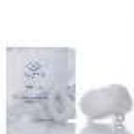
Shower Cap & Band غطاء للرأس مع ربطة لشعر