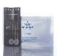
Sewing Ket عدة خياطة