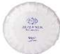
Soap 40 g Paraben free Dermatologically tested صابون ٤٠ غ