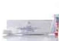
Dental Kit with Colget paste 10g عدة اسنان مع معجون كولجيت 10غ