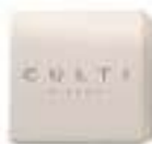
Soap 40 g Paraben free Dermatologically tested صابون ٤٠ غ