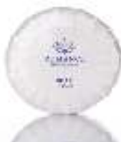
Soap 25 g Paraben free Dermatologically tested صابون ٢٥ غ