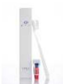
Dental Kit with Colget