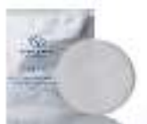
Cotton Pads قطن للوجه