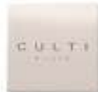
Soap 20 g Paraben free Dermatologically tested صابون ٢٠ غ